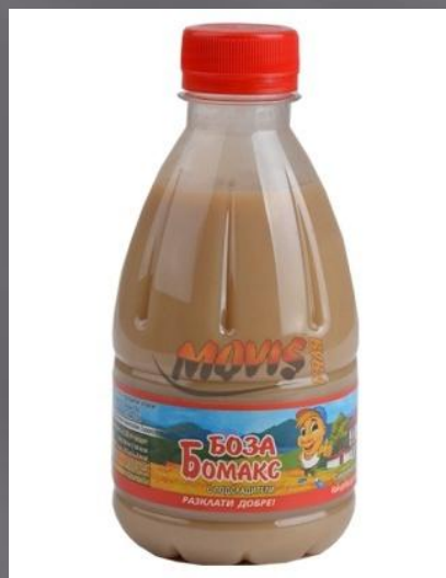
БУЗА Слабоалкогольный напиток