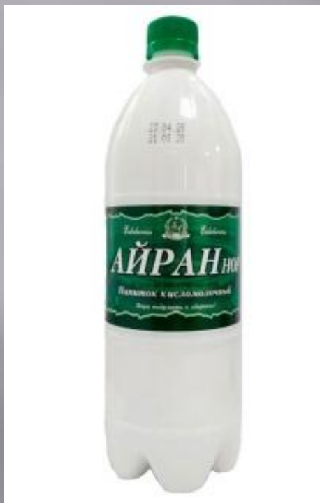
ДУГ (АЙРАН) Кислое молоко