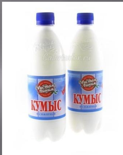
КУМЫС Из конского МОЛОКА