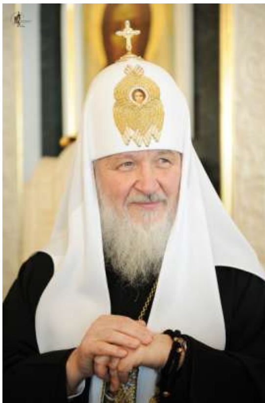
Святейший Патриарх Кирилл

В разные времена с разных сторон двигались на Русь иноземные полчища. Литовцы, шведы, поляки, татары, англичане, немцы, французы, турки шли жечь, грабить, убивать, они хотели покорить русских и сделать их своими рабами. Божьим чудом считались на Руси мирные промежутки в десять-пятнадцать лет.