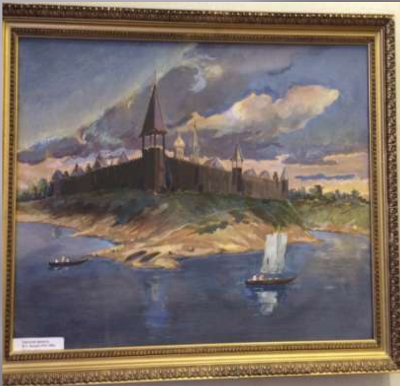
Тарусская крепость М.А. Хвощёв