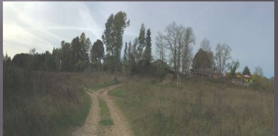
Место, где, по моему мнению, могло быть городище