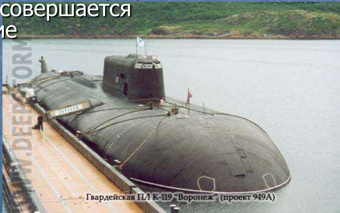
Гвардейская ПЛ К-119 «Воронеж» (проект 949А)

Для Владимира это была первая автономка.