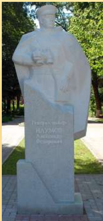
Памятник генералу А.Ф. Наумову