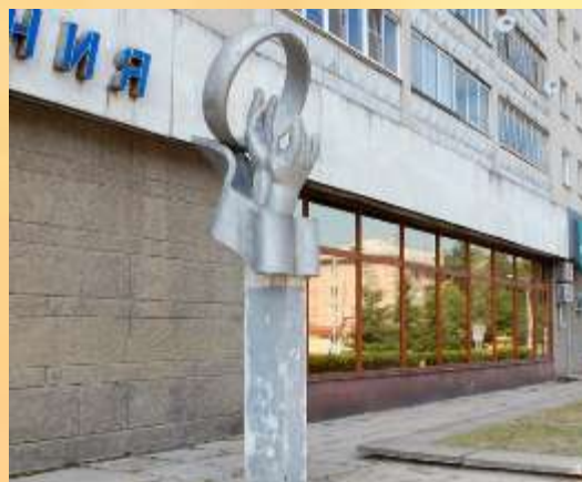
Две руки и обручальное кольцо