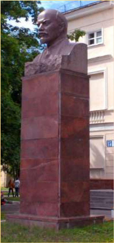
Памятник В.И. Ленину